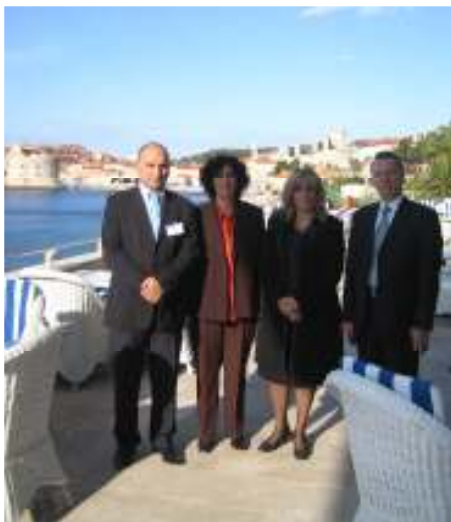
Директорот на АКН со претставници од АКН, за време на Генералното собрание во Дубровник, 7 - 10 октомври, 2007.